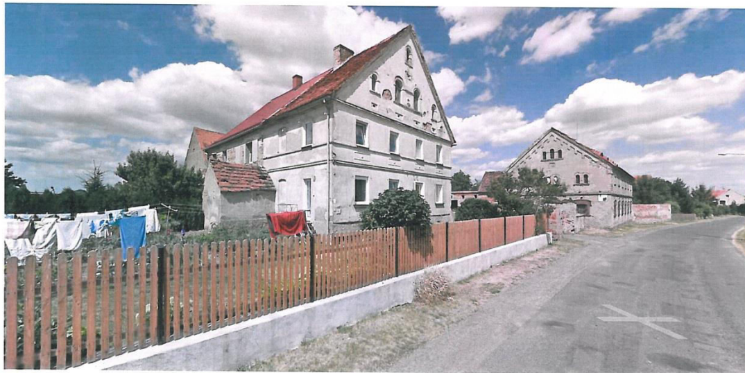
Droga powiatowa bez chodnika.