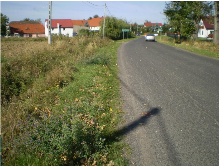
Droga powiatowa bez chodnika.