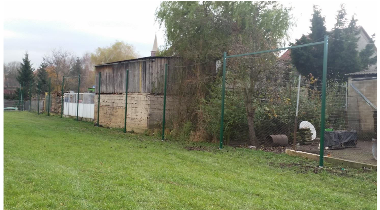
Realizacja II etapu za kwotę 15 621 zł