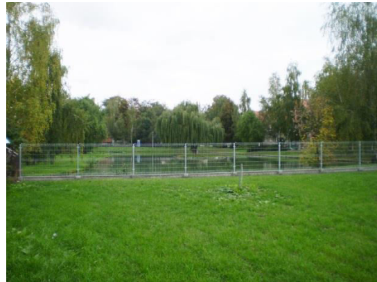
Realizacja I etapu za kwotę 9 471 zł